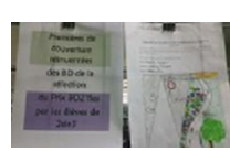
réinvention de l'ère de couverture,

Mme DRENEUC Garlon, professeure-documentaliste Lycée Félix Eboué. 2017/2018.